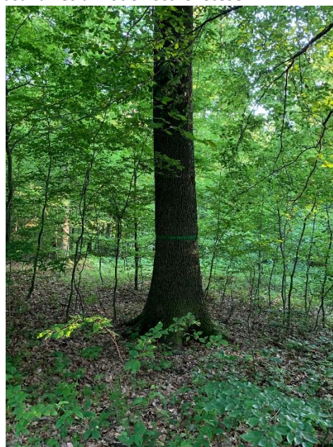
2. kép. 70 cm feletti KTT egyed.