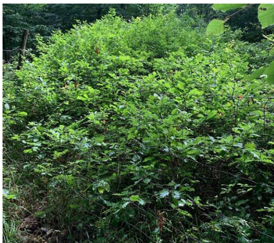
3. Kép. 8 m átmérőjű közepén 3 m magas Ktt utánpótlás kis lékben.