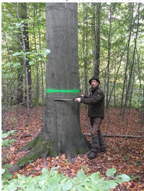
1. kép. Célátmérőt elért bükk (80 cm)